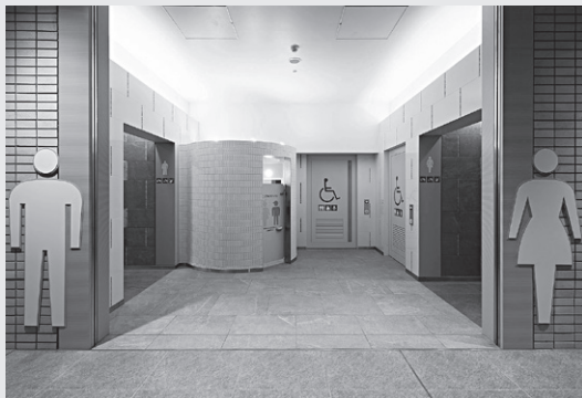
小田急下北沢駅トイレ 写真提供:設計事務所コンドラ